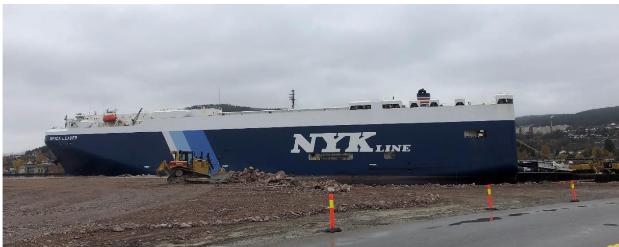
«Spica Leader» til kai på Risgarden 31.10.2020

I oktober måned har vi også montert poretrykksmålere på sjøbunnen utenfor Holmen. Disse er plassert ut for å sjekke geoteknisk stabilitet på Holmen etter hvert som vi starter på den nye utfyllingen øst for 0-alternativet (90 mål i henhold til godkjent reguleringsplan). Det er et