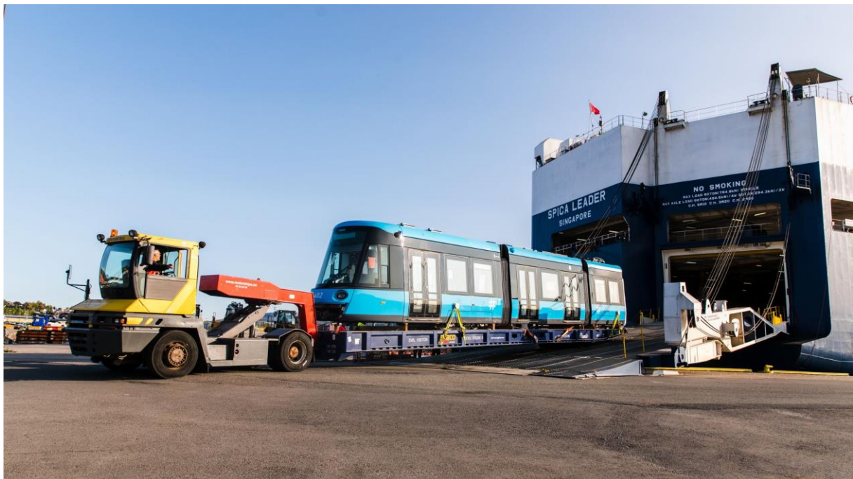
«Spica Leader» losser de første trikkene til Sporveien 19.09.20 på Risgarden

The total value of the tram order is estimated in excess of NOK 4 billion, roughly EUR 360 million. In addition to being significantly lighter and quieter than Oslo’s outgoing tram fleet, the new trains are designed with improved access for wheelchairs and strollers. All 87 trams are expected to be in service by the end of 2024.