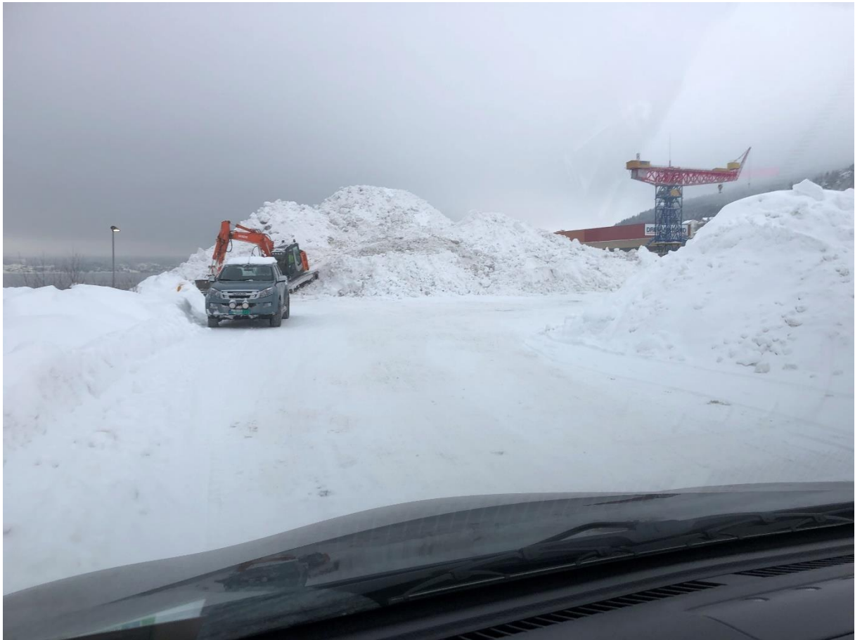
Lagring av snø på Risgarden februar 2019