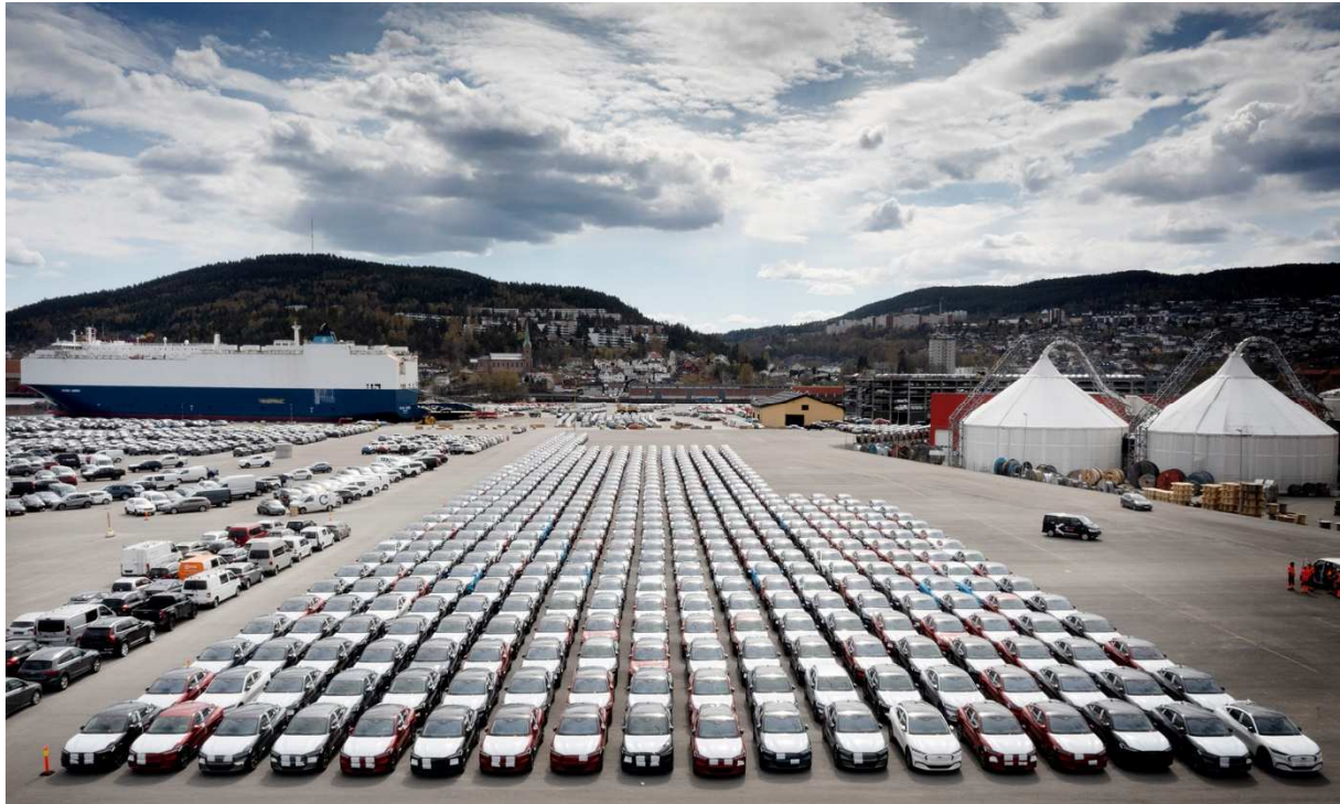
Ford Mustang Mach E losset fra «Viking Amber» 28.04.2021

Bilimporten har vært meget stor i første kvartal og det har blitt losset 32.278 kjøretøy. Dette er en økning på 30% sammenliknet med tilsvarende periode i fjor. Mange nye modeller lanseres i år og det er forventet en fortsatt høy bilimport den kommende tiden. Den 28.april kom de første Ford Mustang Mach E til Norge og nærmere 1000 biler av denne modellen ble losset på samme skipning. Vedlagt Ford Norge sin link fra losseoperasjonen: https://www.youtube.com/watch?v=9mAc5FA7ktU