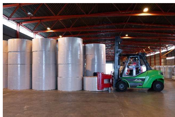
Papirruller til Norgips fraktes nå med 45'containere til Drammen havn.

Se vedlagte pressemelding om Norgips sin satsing på short-sea og jernbane.