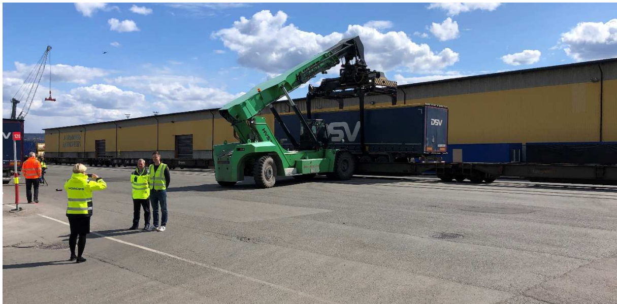
Første semihenger med gipsplater løftes på containertoget den 29.04.2021

Det vises til styresak 2 i møte 22.03.21. Torsdag 29. april hadde Norgips sin første forsendelse av gipsplater på semihengere, lastet ut med jernbanen på Holmen. Greencarrier har nå fått på plass truck med løfteutstyret til denne type lastebærere og Norgips kommer til å sende 5-6 semihengere med gipsplater daglig fra havna. Det var representanter fra ledelsen hos Norgips, DSV, Cargonet, Greencarrier og Drammen havn tilstede og markerte begivenheten