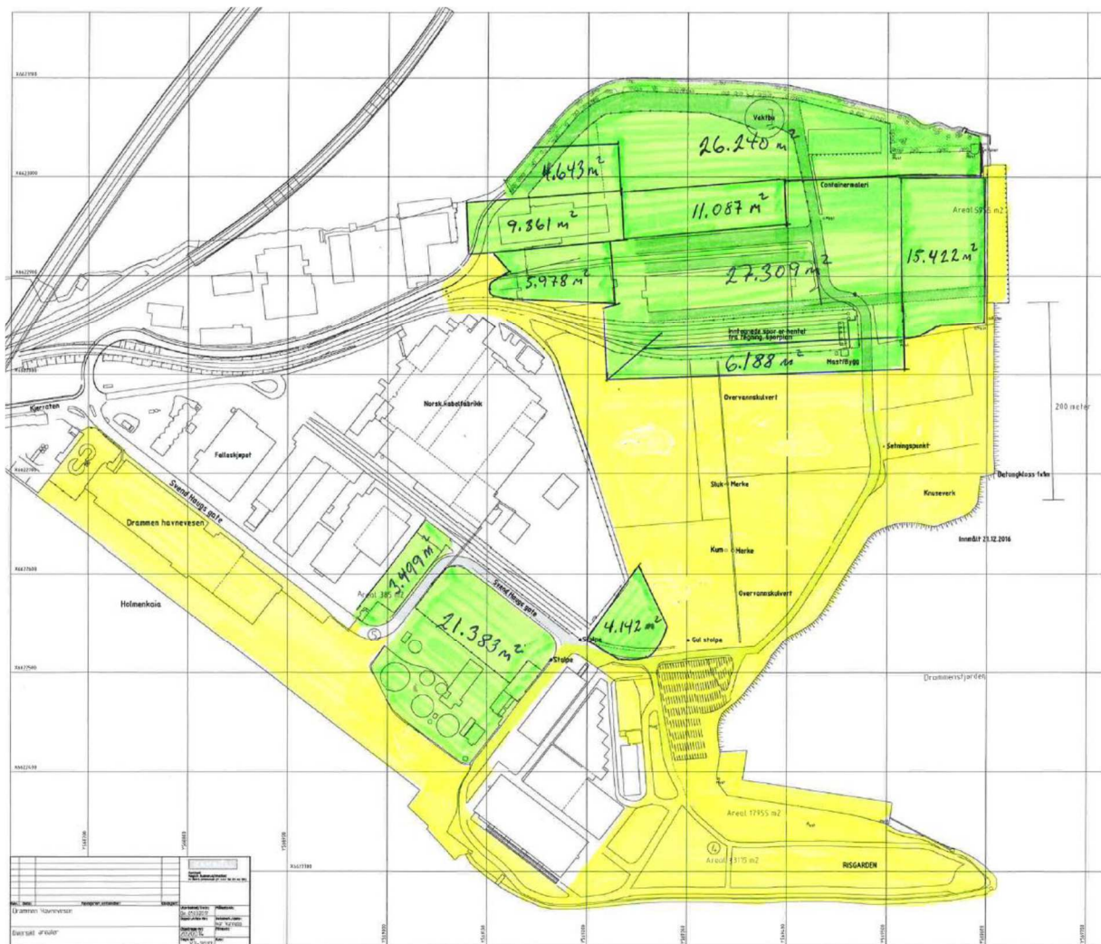
Kart over festeavtaler på Holmen. Festeavtalene omfatter arealer på nordsiden av Holmen (106 daa) mot Bragernesløpet, inngått i perioden 1981-1995. De tre grønne arealene ved tankanleggene er kompensasjon for Drammen havn sin fraflytting på Tangen.

Som en del av oppgjøret for Drammen havn sin fraflytting fra Tangen-kaiene i 2017, betales det ikke festeavgift eller leie for disse arealene frem til 2041.